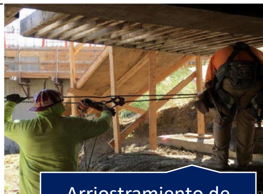
Arriostramiento de cimbra tensora