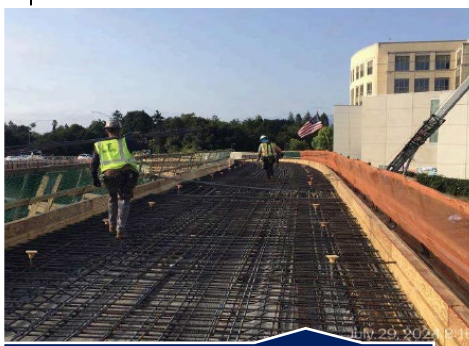
Colocación de barras de refuerzo de cubierta